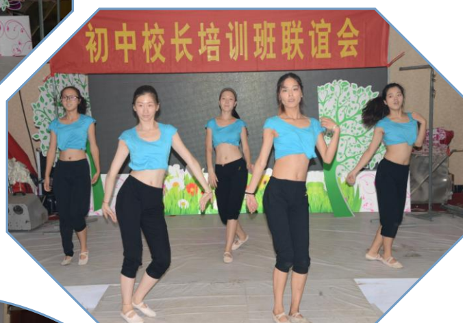
师大音乐系学生的优美舞蹈