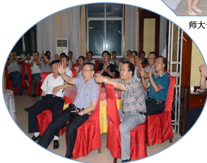
热闹的联谊会现场