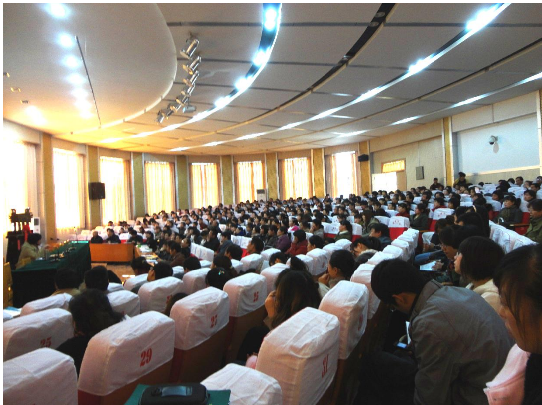
2011年10月25日在垣曲中学“数学阅读教学”报告会现场