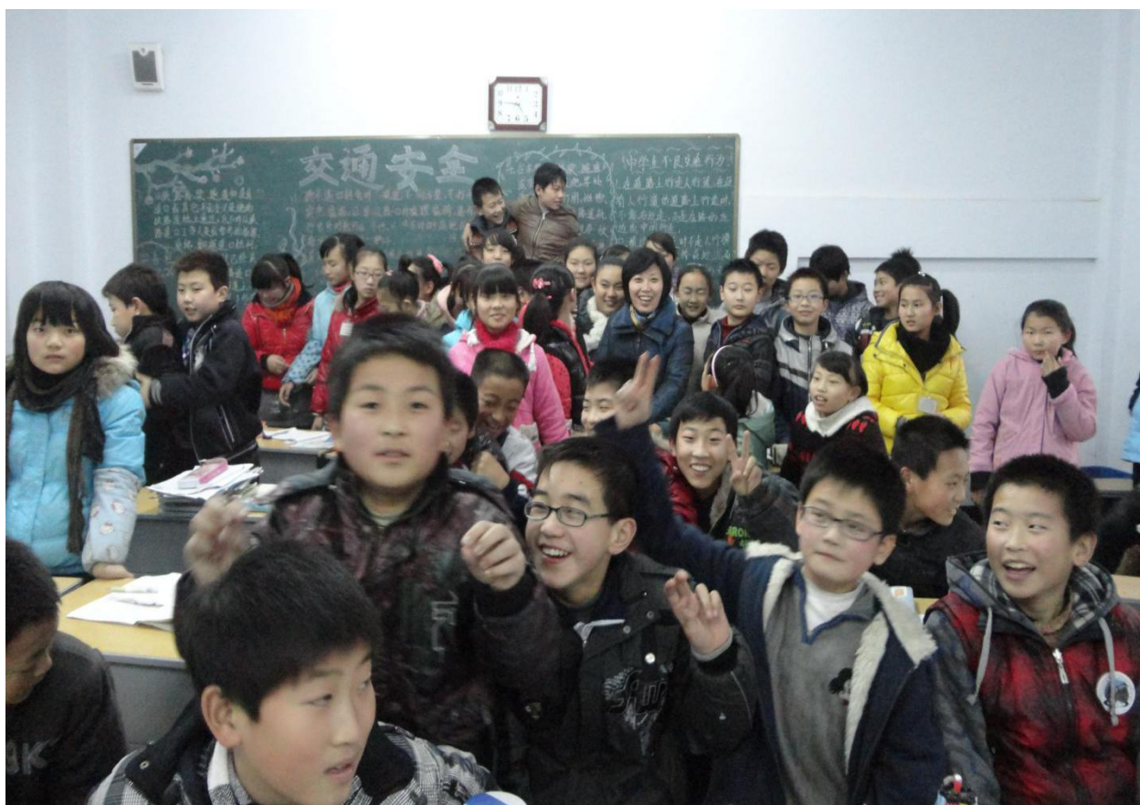
和 28 班的学生在一起