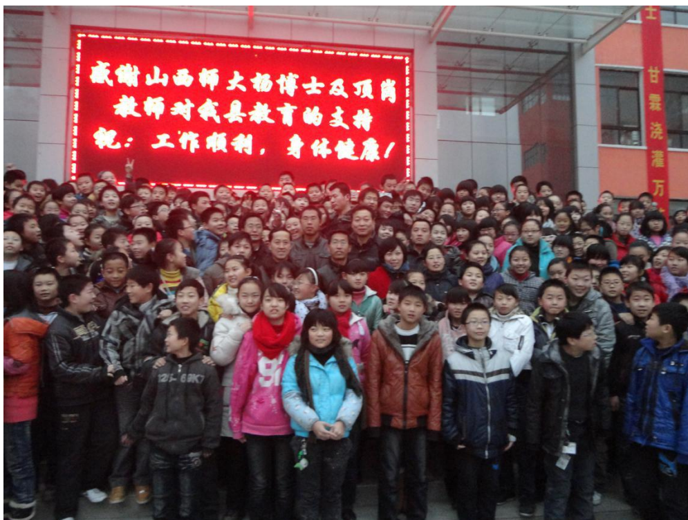
移民初中的欢送场面