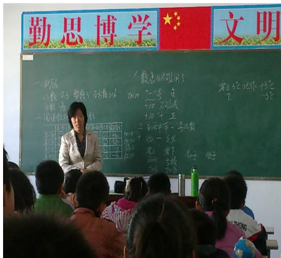
在移民初中 28 班上课