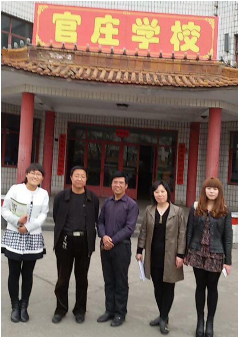
(四) 体验实习生的生活