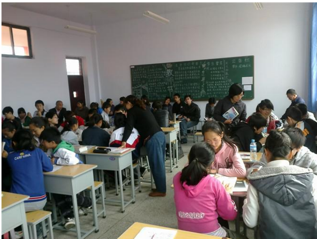
师生一起观摩教学