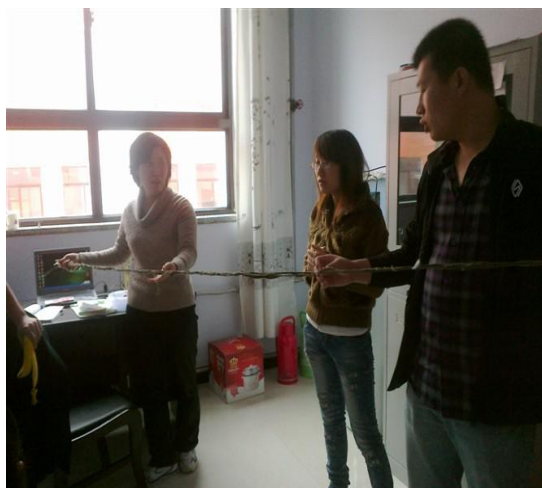
师生一起自制坐标轴教具