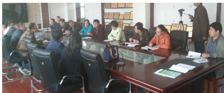
参加清徐公开课教研活动

十年来，我和我的同事们努力工作，我们的支教学生也展现了他们的青春风采，为我们山西师范大学争得了社会的认可与荣誉。我搜索了一些照片，做为我的工作总结尾声吧。