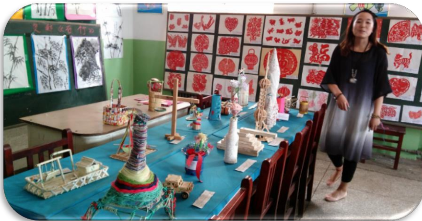
参观柳杜中学实习学生组织的美术活动展室时照片