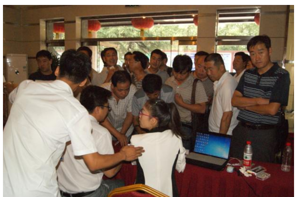
临汾市思麦尔商务快捷酒店报到处