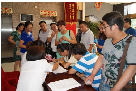
临汾市市委党校培训中心报到处